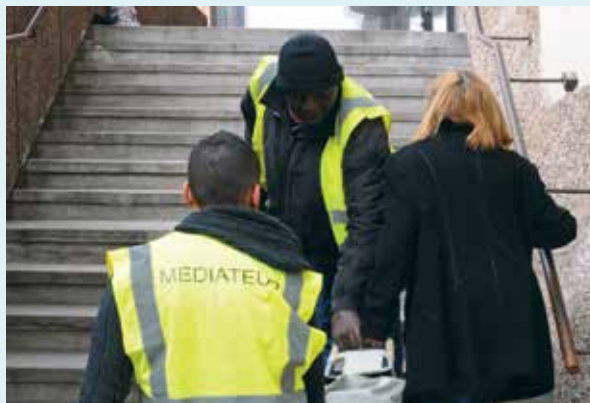
Pour accompagner le début des travaux et mieux vous aider, une équipe de médiateurs a été mobilisée.