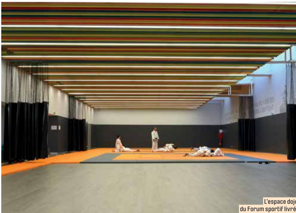
L'espace dojo du Forum sportif livré.

Lumière, couleurs, sols : tout est conçu pour créer une ambiance dynamique et conviviale dans l'espace dojo – qui peut accueillir le public confortablement – et dans les salles de boxe et de musculation. Le nouveau hall, largement dimensionné, ouvre sur la rue du Vieux Pont de Sèvres et un puits de lumière a été créé pour faire entrer un éclairage naturel maximal. Trois autres espaces dédiés à des activités associatives seront aménagés dans un second temps pour achever la rénovation de l'Espace Forum.