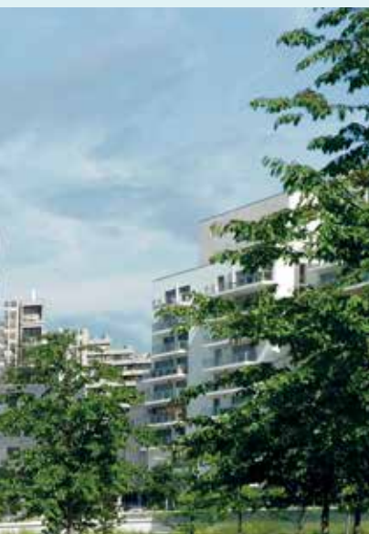
CityLights vu depuis le Parc de Billancourt. Pour tout savoir : www.citylights-etvous.com et/ou contact@citylights-etvous.com