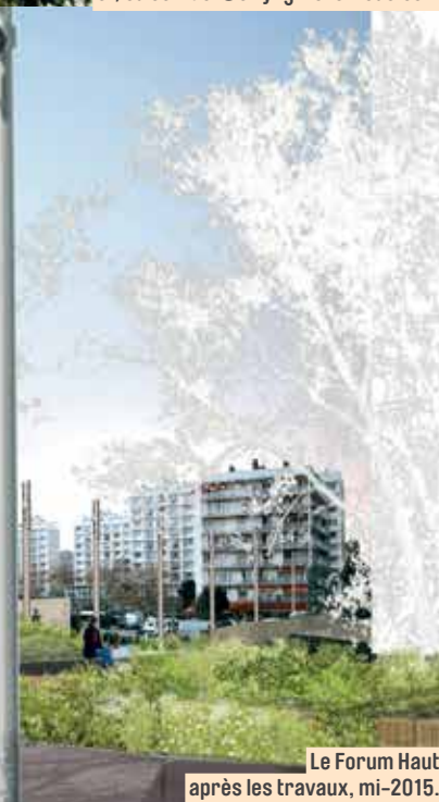
Le Forum Haut après les travaux, mi-2015.