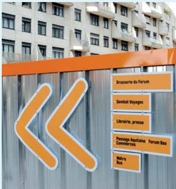
Une signalétique évolutive adaptée aux travaux a été installée dans le quartier.