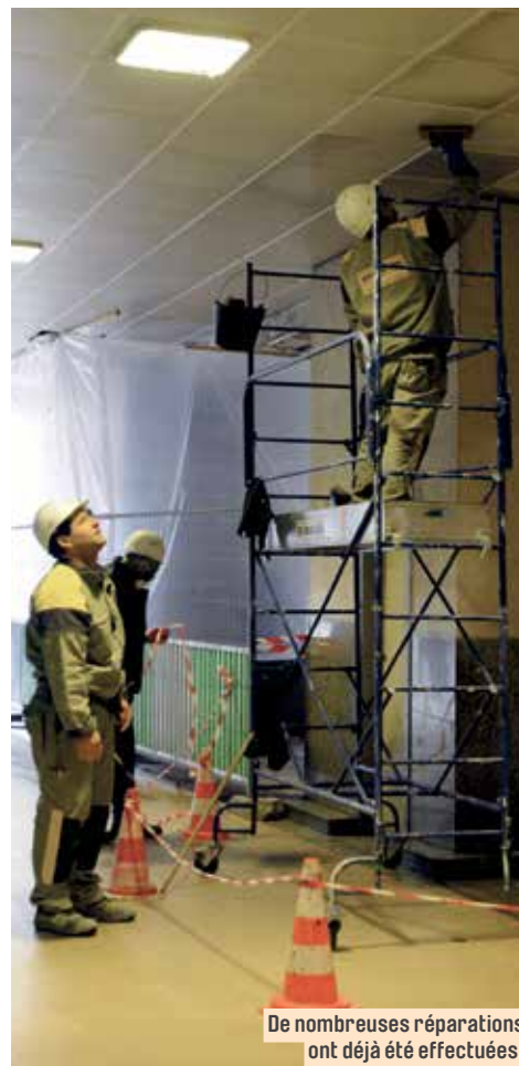
De nombreuses réparations ont déjà été effectuées.

À noter : nous vous invitons à informer l'Antenne municipale du Pont de Sèvres et de la Politique de la Ville des difficultés ou des dégradations que vous remarquez. Elle les transmettra aux partenaires de la Gestion Urbaine de Proximité et organisera les actions de réfection dans les meilleurs délais.