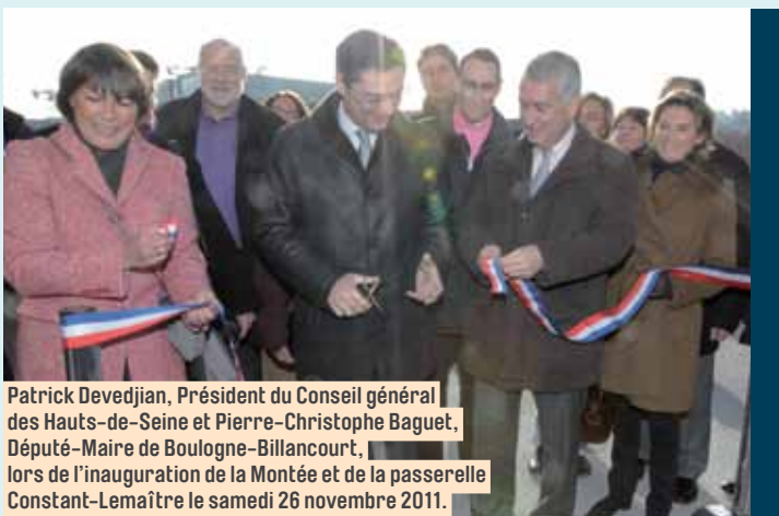
Patrick Devedjian, Président du Conseil général des Hauts-de-Seine et Pierre-Christophe Baguet, Député-Maire de Boulogne-Billancourt, lors de l'inauguration de la Montée et de la passerelle Constant-Lemaître le samedi 26 novembre 2011.

La crèche de la Girafe (5,6 M€) est financée par la Caisse d'Allocations Familiales, la Ville, la Région Île-de-France, le Conseil général des Hauts-de-Seine et l'ANRU.