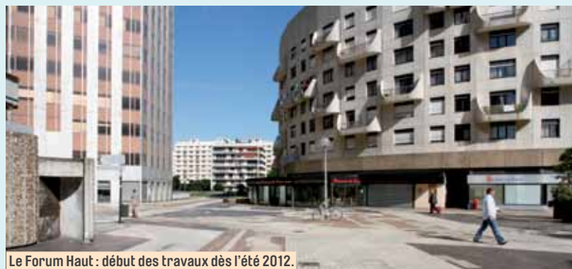
Le Forum Haut : début des travaux dès l'été 2012.