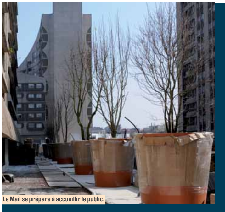
Le Mail se prépare à accueillir le public.