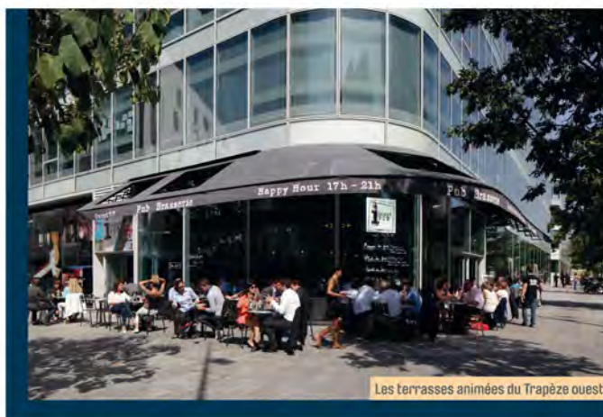
Les terrasses animées du Trapèze ouest.

Le lancement de ce nouveau secteur, avec des ambitions fortes en termes de dynamique économique et de qualité de vie, témoigne de la vitalité et de l'attractivité de Boulogne-Billancourt. Son achèvement est prévu pour 2016.