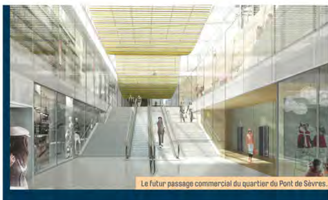
Le futur passage commercial du quartier du Pont de Sèvres.

Le quartier du Pont de Sèvres va bénéficier du développement et de la rénovation de ses espaces commerciaux, dont la superficie passera de 6 200 m 2 à 11 200 m 2 . Cet ensemble accueillant facilitera l'intégration du quartier dans la ville et le rendra plus agréable pour ceux qui l'habitent ou le traversent. Après les travaux, un gestionnaire unique aura la responsabilité d'assurer un pilotage cohérent et dynamique et une animation attractive du pôle commercial rénové. Il veillera également à la pérennisation d'un bon équilibre entre les différents types de commerces.