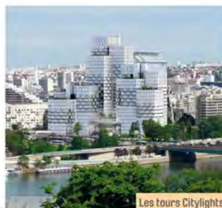
Les tours Citylights.

Le projet vise à donner aux tours une fluidité et une luminosité qui vont les inscrire de manière qualitative dans le paysage urbain. Il ouvre également le bâtiment sur le quartier en cours de rénovation et sur les transports en commun actuels et futurs en réaménageant le rez-de-chaussée pour le relier au Forum Haut.