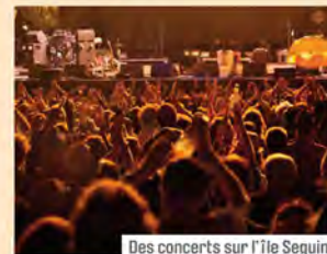
Des concerts sur l'île Seguin.

Un partenariat public-privé pour le pôle musical En décembre 2011, le Conseil général des Hauts-de-Seine a voté le lancement d'un Partenariat public-privé pour la réalisation du pôle musical de la pointe aval de l'île Seguin. Ce programme comprend un ensemble musical à rayonnement international inscrit au cœur de la Vallée de la Culture. Il sera composé d'un auditorium de 900 places dédié à la musique classique, d'une grande salle de 3 000 à 5 000 places consacrée à la musique amplifiée, de plateaux de répétition et de commerces à vocation culturelle. Les travaux seront lancés au début 2014 et seront achevés en 2016.