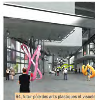
R4, futur pôle des arts plastiques et visuels.

promenade artistique inédite. Monumentales ou intimistes, les œuvres présentées ont permis de prendre symboliquement possession de l'espace qui accueillera R4 à l'horizon 2016.