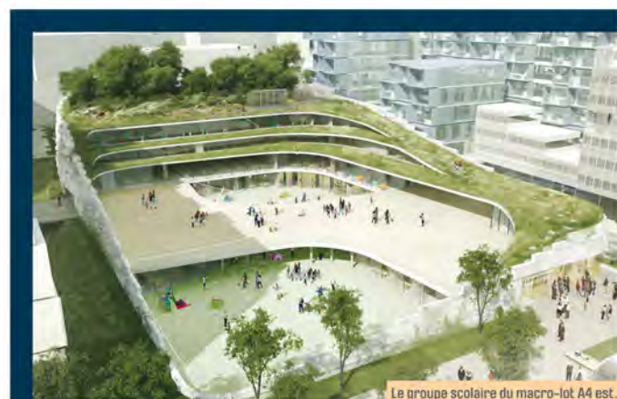
Le groupe scolaire du macro-lot A4 est.